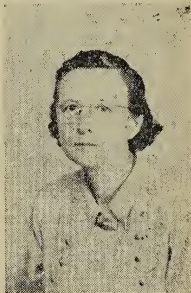
26 agosto 1904-3 octubre 1960

La Federación Femenina Evangélica Valdense dedica en esta ocasión su espacio en MENSAJERO VALDENSE a quien fué una conductora consagrada y entusiasta de la obra femenina en el Distrito y un instrumento en manos de Dios para toda obra buena.